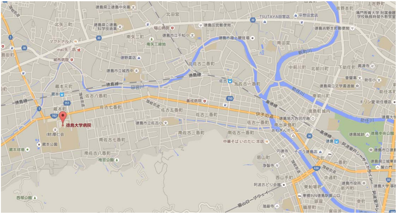
徳島大学病院日亜ホール会場案内図