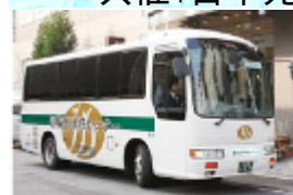
JR大阪駅桜橋口ガード下からシャトルバス運行中 (毎日午前8時から午後7時まで)